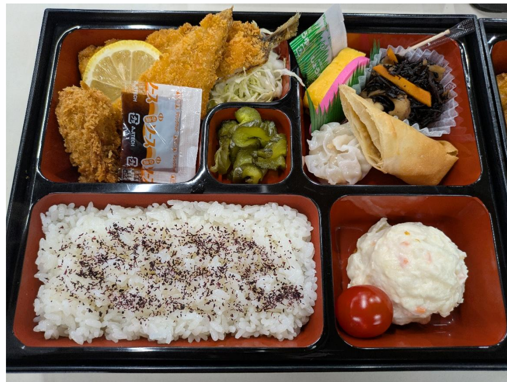
1000円のお弁当のサンプル (内容は仕入れによって変更することがございます)